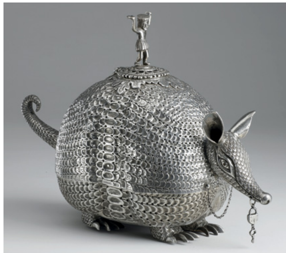
„Sztuka Wicekrólestwa Peru” Kadzielnica w formie pancernika, autor nieznany, Andy Południowe, XIX w., srebro